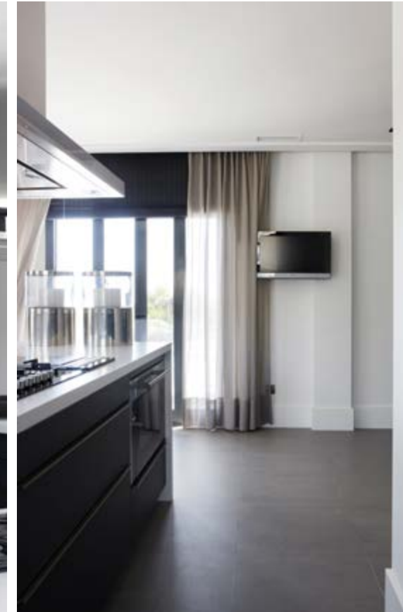
De keuken lieten de bewoners maken door een lokale keukenbouwer met kastjes in wengéhout en een blad in ceasar stone. De barkrukjes zijn van Vincent Sheppard.

worden? Waar komt de verlichting? “Eerlijk gezegd hebben wij niet heel veel smaak wat dat betreft. Om het echt mooi te maken, hadden we de hulp van een interieurontwerper nodig. Dat zagen we wel in.” De winkel van Avenue 33 kenden ze uit hun woonplaats Abcoude. En ze aten weleens in een restaurant dat door dat bureau was ingericht. De stijl sprak hen aan: elegant, tijdloos, mooie materialen, uitgebalanceerd. Na de eerste kennismaking volgde al snel een bezoek aan het huis in aanbouw en daarna ging de bal echt rollen.