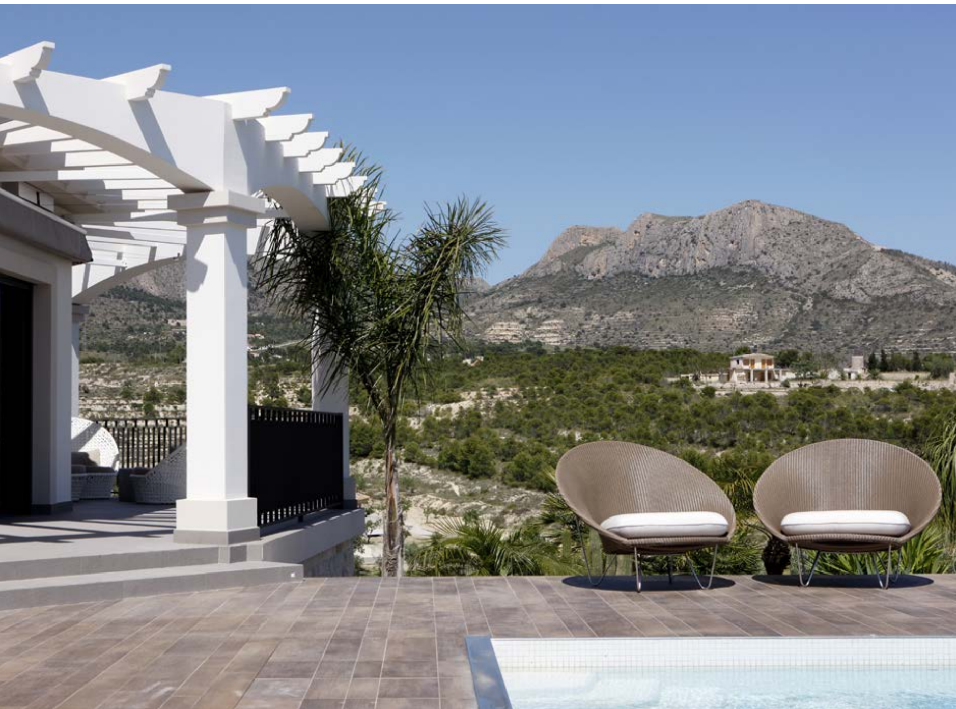
Langs het zwembad met witte mozaïektegeltjes is het heerlijk genieten in de ligstoelen van Manutti. De kuipstoeltjes en de stoelen aan de buitentafel zijn van Vincent Sheppard.

“De tuin heeft kleur gekregen door de beplanting, terwijl het interieur tot leven komt door het spelen met contrasten”