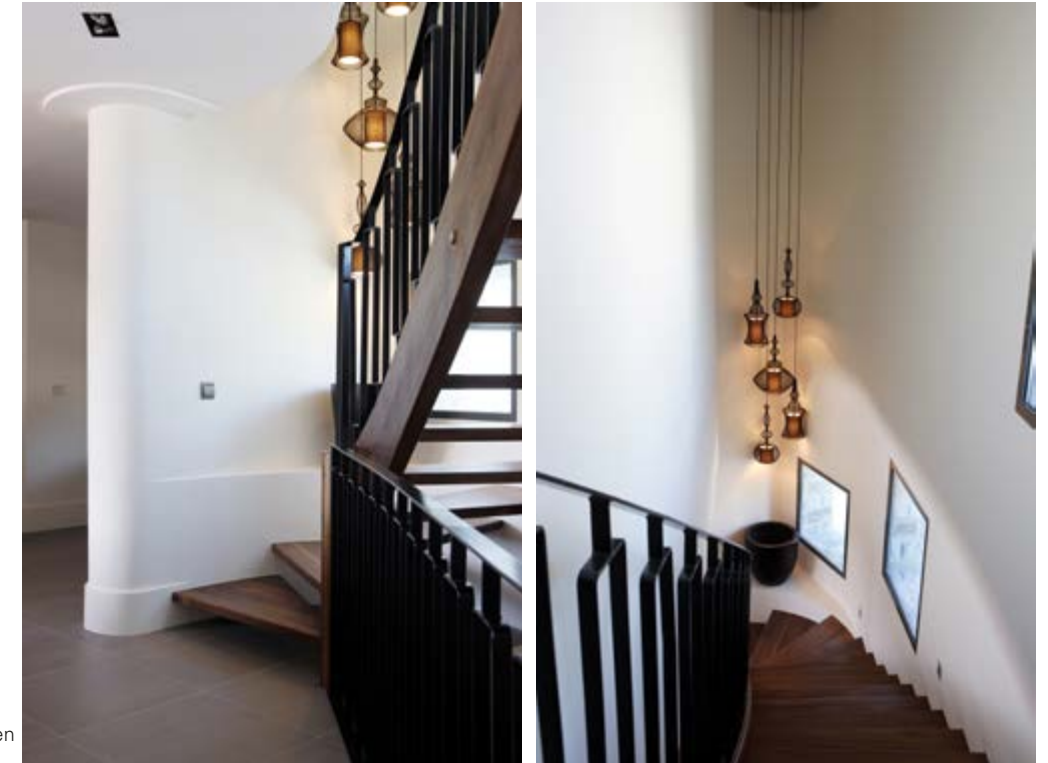
De bijzondere lampen zetten de traphal in een exotisch licht. Ze zijn van het merk Forestier.