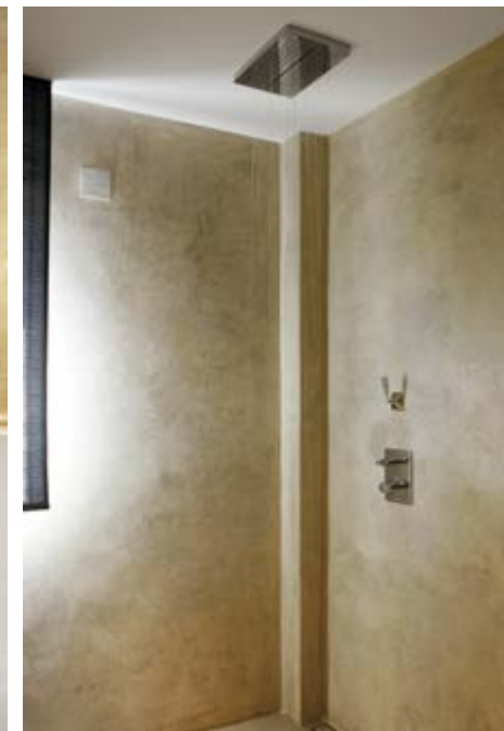
Foto linksboven: het hoofdbord werd op maat gemaakt door Keijser & Co. De lampjes zijn van Stout verlichting en het beddengoed komt van Zara Home. Foto's onder: de badkamer heeft een warme uitstraling dankzij tadelakt op de wanden. Het sanitair is van Clou.