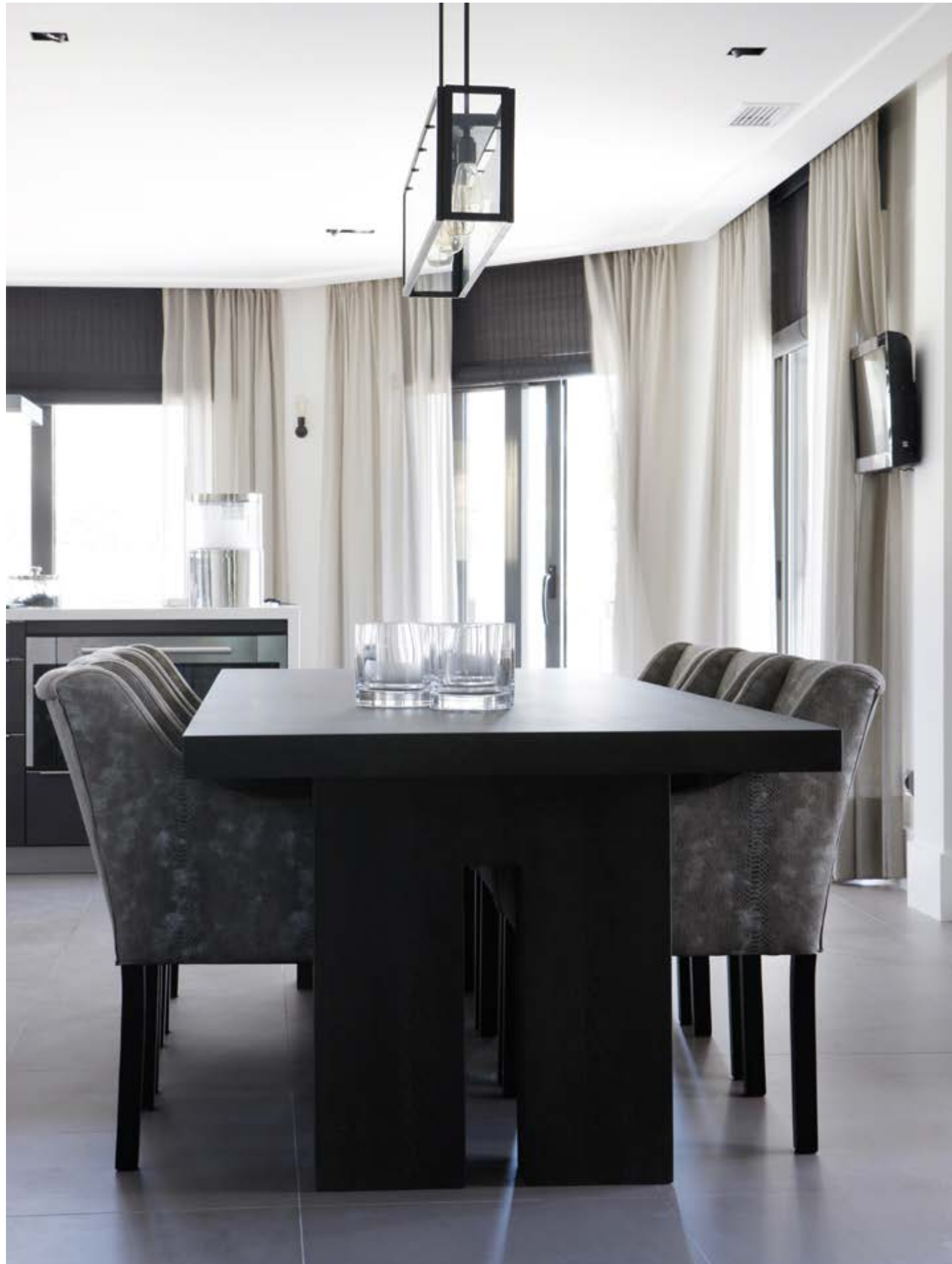
De tafel en stoelen zijn van Keijser & Co. De lamp is van Nautic.